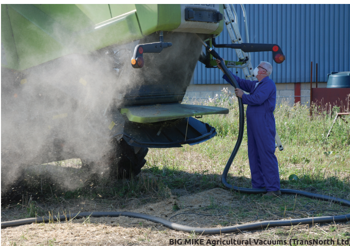
BIG MIKE Agricultural Vacuums (TransNorth Ltd)