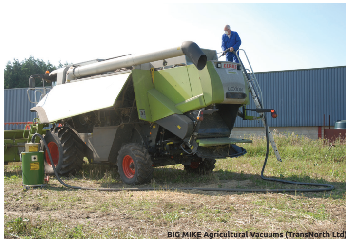
BIG MIKE Agricultural Vacuums (TransNorth Ltd)

De façon générale, pour les prochaines étapes, il faut nettoyer toutes les surfaces par soufflage et brosseage. Utilisez un aspirateur pour les espaces clos ou semi-clos. Il est parfois nécessaire d'utiliser des outils de récurage pour enlever manuellement les résidus durcis et encroûtés.